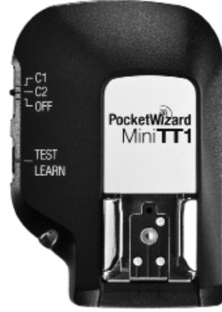
Canon E-TTL II Nikon CLS / i-TTL ile uyumlu

Nikon ve Canon flaşlar için MiniTT1® Verici ve FlexTT5® alıcı-verici ile altını çizdiği yeni ControlTL platformu, 'tak ve çek' basitliğini sunarak iş akışınızı kolaylaştırıyor. PocketWizard MiniTT1 ve FlexTT5 sizlere, lokasyonda, stüdyoda, köşelerde, görünmeyen yerlerde ve dahası güneşin altında, makinadan bağımsız TTL ya da manuel güç kontrolü sunuyor.